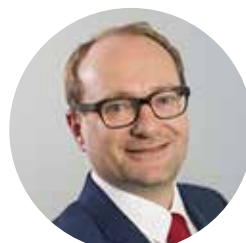
Ben Weyts Vlaams minister van Onderwijs