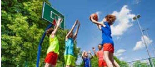
N-VA maakt eerlijke keuzes in sportbeleid p.2