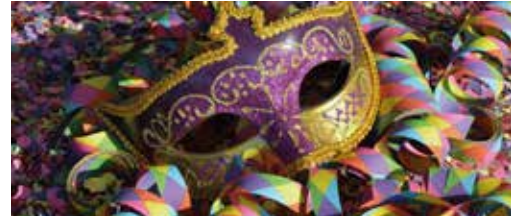
Ook senioren vierden carnaval p.3